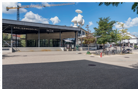
Das internationale Stipendienprogramm «Atelier Mondial» steht Kulturschaffenden aus den beiden Basel, dem Kanton Solothurn sowie den Gebieten Südbaden und Elsass für Werkaufenthalte offen. Im Basler Dreispitz gibt es sieben Ateliers.

Die beiden Basel sowie der Kanton Solothurn beteiligen sich am Projekt «Atelier Mondial». Das internationale Stipendienprogramm bietet Kulturschaffenden aus der Region Basel, dem Kanton Solothurn und den Gebieten Südbaden und Elsass mehrmonatige Aufenthalte in einem von elf Partnerländern weltweit. Insgesamt werden jährlich 12 Atelierstipendien und 3 Reisestipendien auf der Website des Projekts ausgeschrieben.