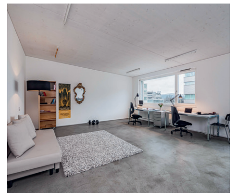
Ein grosses Studio von «Atelier Mondial».