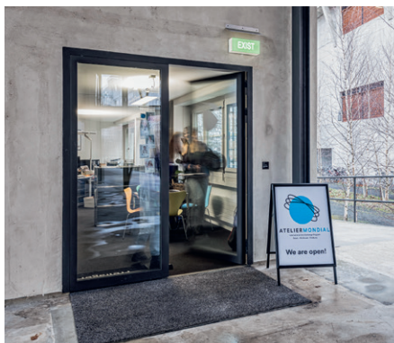
Das Büro von «Atelier Mondial» auf dem Dreispitz-Areal in Basel.