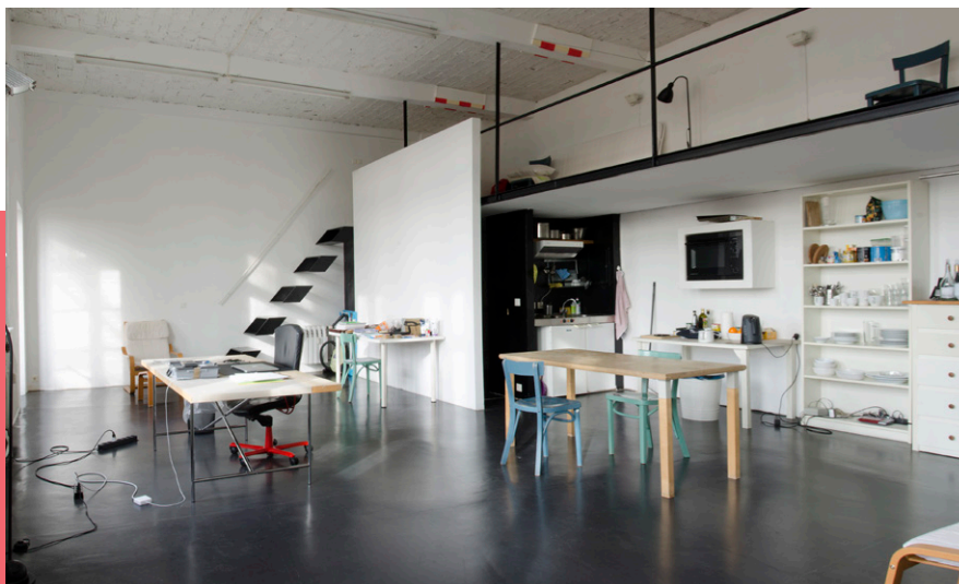
Der Kanton Zug betreibt in Berlin ein Atelier für Kulturschaffende aus dem Kanton. Es befindet sich 10 Gehminuten vom Alexanderplatz entfernt.