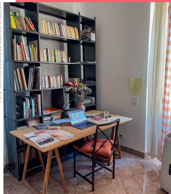
Die Kantone Graubünden und St.Gallen stellen Kulturschaffenden eine Atelierwohnung in Rom zur Verfügung.